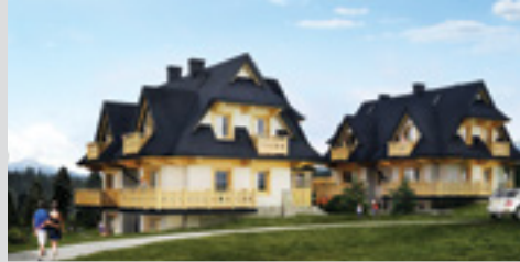
Zakopane - ul. Cyrhla